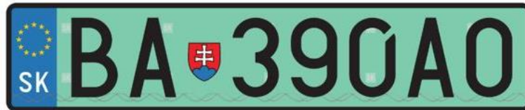
Vzor zelenej EVČ

Bližšie informácie o postupe pre vybavenie zelených EVČ nájdete TU .