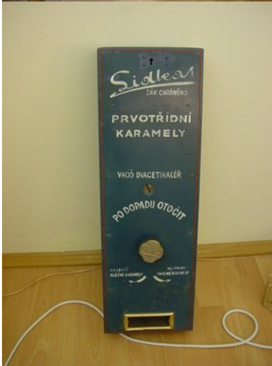
Zre-ťauované predmety pre výstavu: registra ná poklad a šNationalõ a automat na cukríky šLidkaõ

g) Odborno ó metodická, lektorská innos , spolupráca s inými in-titúciami.