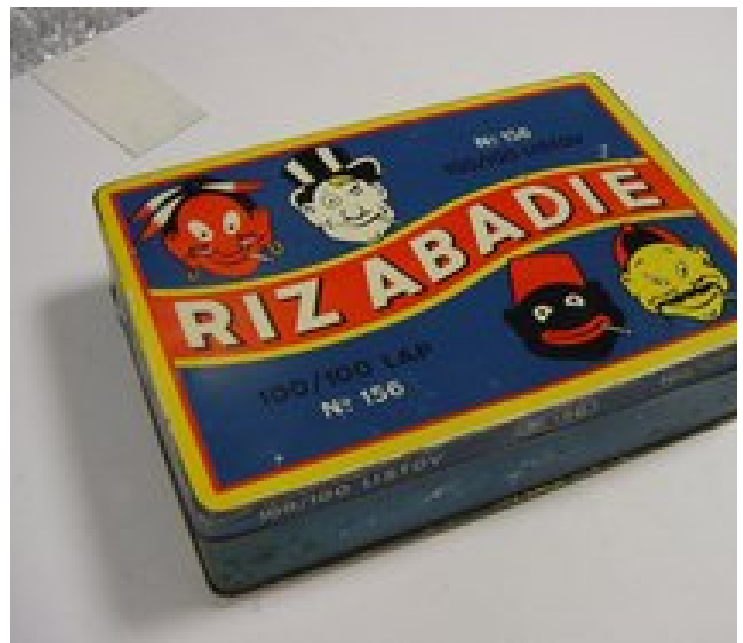
Predmety z akvizície v roku 2008 óplechová –katu a na cigaretové dutinky õAbadieõ