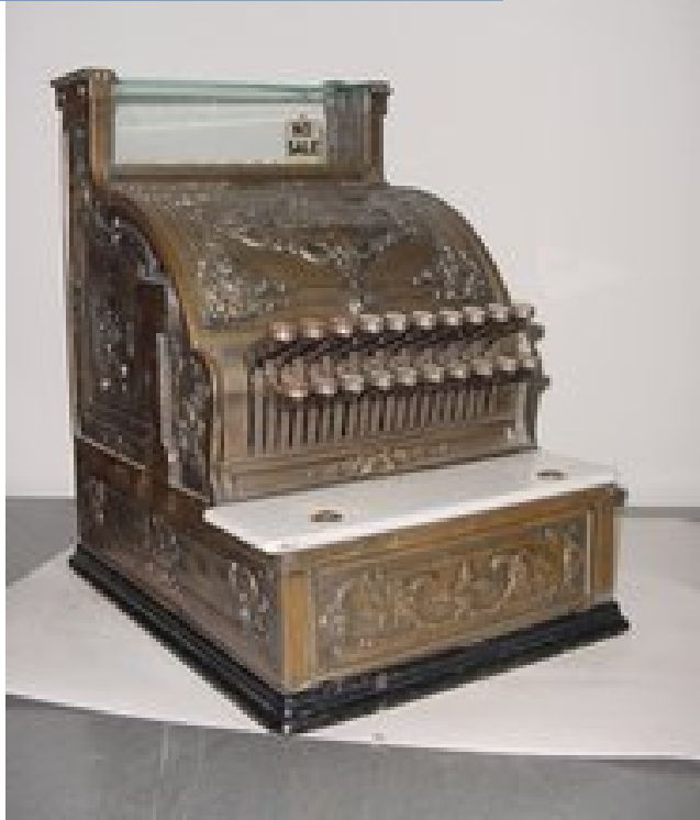
Predmety z akvizície v roku 2008 ó registra ná poklad a šNationalö