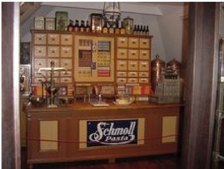
Stála expozícia o interiérovom obchode so zmiešaným tovarom

a najatraktívnejšieho, čo v zbierkovom fonde múzea je. rôznych typov, kartónová interiérová reklama, poštové známky, registračné pokladne, zásobníky na tovar rôznych typov a pomôcky na upravenie a manipuláciu s tovarom. Dôležitým prvkom je interiérový obchodník so zmiešaným tovarom do ktorého môže návštevník vstúpiť. Ako solitéry sú v komunikačnom priestore umiestnené sadrové, kámenované reklamné pútače. Na stenách celého priestoru sú nainštalované reklamné plagáty a smaltované a plechové reklamné tabule. Do priestoru bol umiestnený zásuvkový základňa pražskej firmy Lotech, na plagáty, písomnosti a drobné predmety. Expozícia má 4 okruhy ozvenia, efektívne osvetlenie a je opatrená audiovizuálnou technikou. Celá expozícia je bezbarierová vrátane výstupu a WC pre telesne postihnutých návštevníkov. Expozíciu navštevujú najmä študenti Filozofickej fakulty, Ekonomickej univerzity, obchodných akadémií a okolitých základných škôl, zároveň sa stáva zastávkou zahraničných zájazdov smerujúcich do Bratislavy z celého Slovenska.