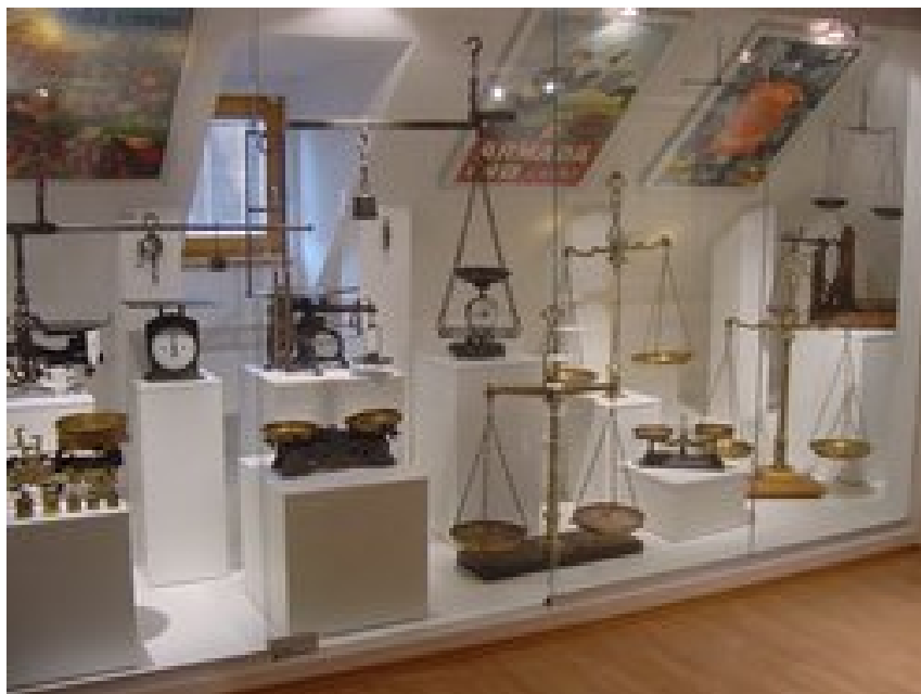
Stála expozícia o váhach.