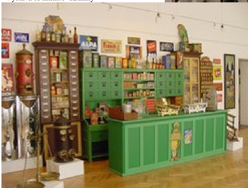
Výstava šKupujeme - predávameõ- Ko-ice