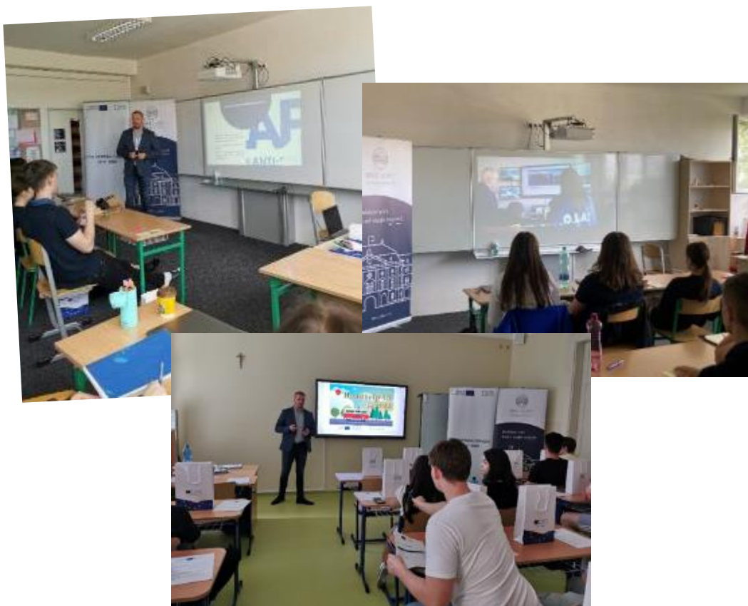
Prednáška na Súkromnom bilingválnom gymnáziu BESST a na Arcibiskupskom gymnáziu biskupa P. Jantauscha v Trnave, 03. jún 2022