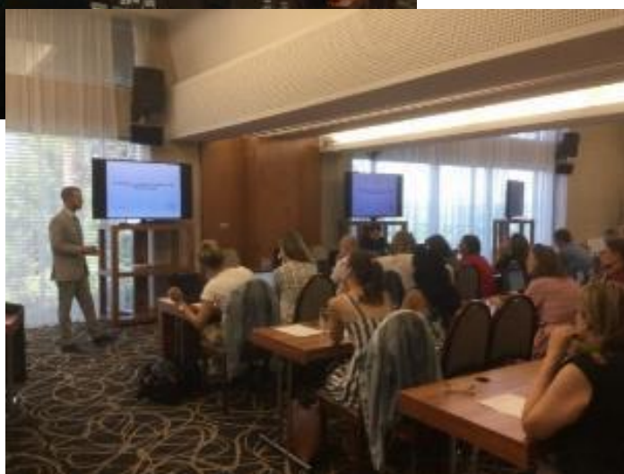
„Zmeny zákona o verejnom obstarávaní v roku 2022 a ich dopady“, 27. 06. 2022, účelové zariadenie ÚV SR Hotel Bôrik, Bratislava