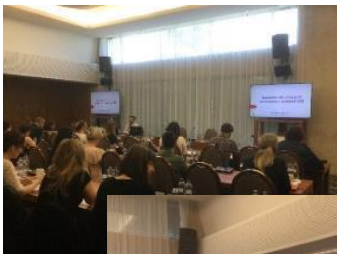
„Riadenie rizík a boj proti podvodom v prostredí EŠIF“, 12. 05. 2022, účelové zariadenie ÚV SR Hotel Bôrik, Bratislava