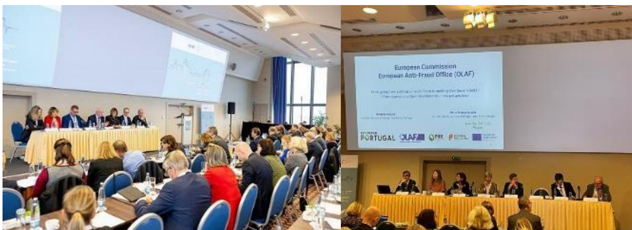
Konferencia EÚ: “Predchádzať - Odhaľovať - Vyšetrovať: Nové výzvy v boji proti podvodom a nezrovnalostiam vo výdavkovej oblasti”, Praha, dňa 23. 11. 2022 - 25. 11. 2022