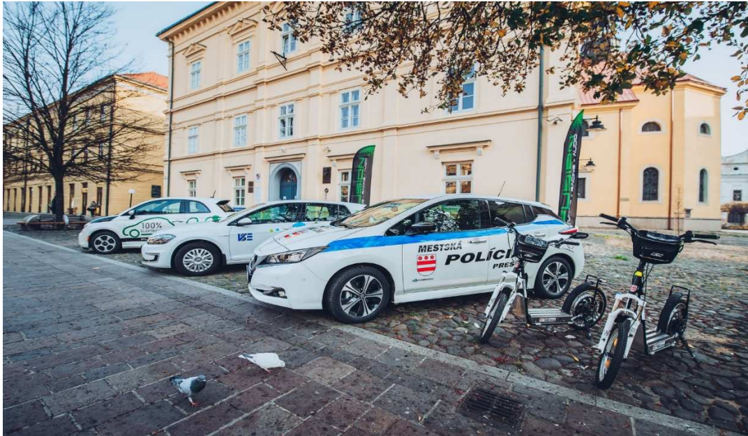
Autosalón elektromobilov v OC Eperia (Prešov) a Konferencia na podporu elektromobility

Dôkazom rozvoja elektromobility v kraji a pozitívneho dopadu projektu PROMETEUS na rozvoj náročnej dostupnosti infraštruktúry je aj rastúci trend výstavby elektronabíjajúcich staníc a zahusťujúcej sa nabíjacej infraštruktúry tak, aby bola schopná pokryť celý kraj. Z pôvodných troch okresných miest na území Prešovského samosprávneho kraja (Poprad, Levoča a Prešov), ktorými bol kraj pokrytý v prvej fáze projektu, sa v súčasnosti verejne dostupné nabíjacie stanice pre elektrické vozidlá rozšírili do deviatich okresných miest vďaka mobilizácii projektových stakeholderov VSE, GreenWay, ako aj e-join.