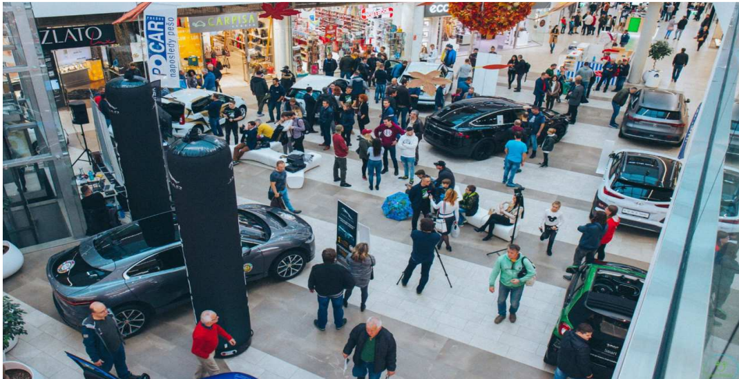
Autosalón elektromobilov v OC Eperia (Prešov) a OC Max (Poprad)

Ďalším z príkladov pozitívneho dopadu projektu PROMETEUS na rozvoj elektromobility v kraji je ekologizácia vozového parku Mestskej polície Prešov. Okrem nového elektromobilu mestská polícia už využíva na hliadkovú činnosť aj elektrické kolobežky. Na nabíjanie elektromobilu mestská polícia využíva bezplatné nabíjacie stanice, má však aj vlastnú nabíjačku v priestoroch Mestského úradu mesta Prešov, významného projektového stakeholdera PROMETEÁ.